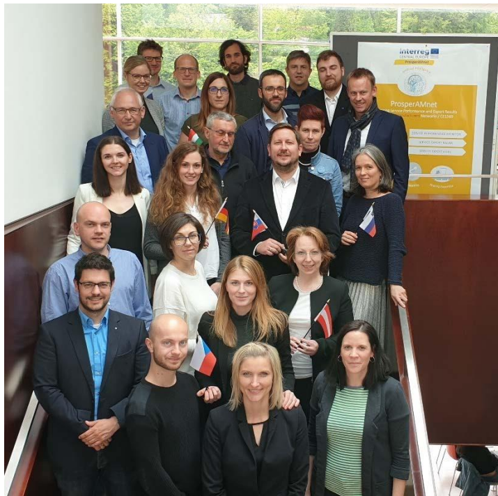
Foto di Gruppo all'evento di lancio del progetto (06-07.05.2019)